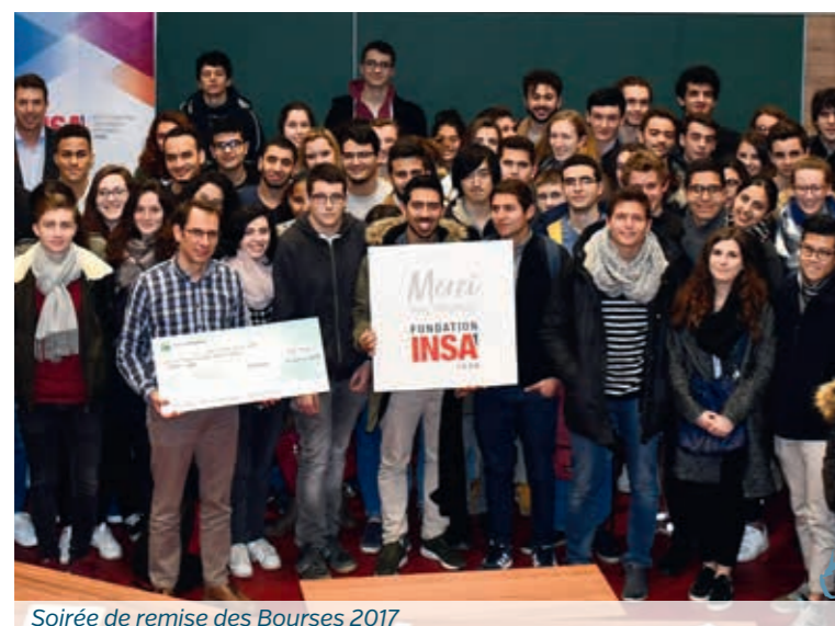
Soirée de remise des Bourses 2017