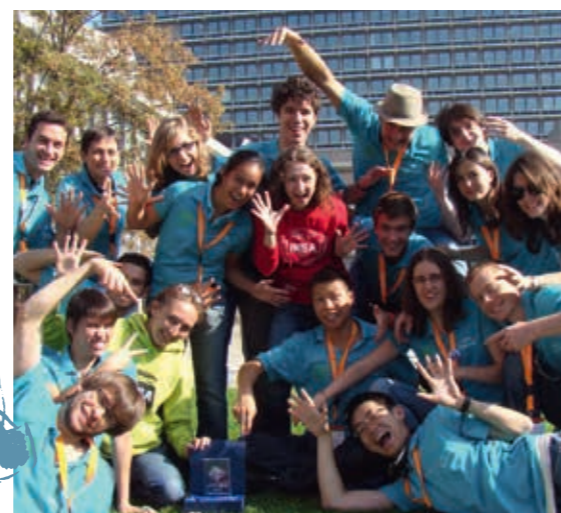
L'équipe IGEM INSA-UPS a remporté la médaille d'or au concours IGEM du MIT [Boston]

Près de 1 230 bourses distribuées pour un montant global de 881 000 €