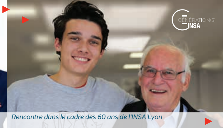
Rencontre dans le cadre des 60 ans de l'INSA Lyon