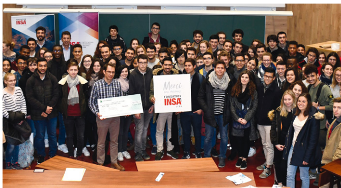
Soirée de remise des Bourses 2018.

Près de 130 personnes ont participé à cette seconde édition de l'événement, désormais incontournable pour la communauté INSALienne.